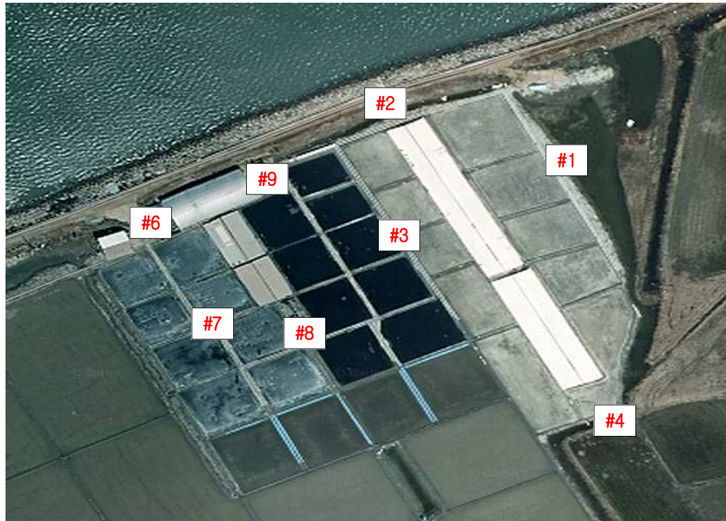
별첨 2). 측정 지점 위치도(도식도) - 염전 해주창고 부지경계선